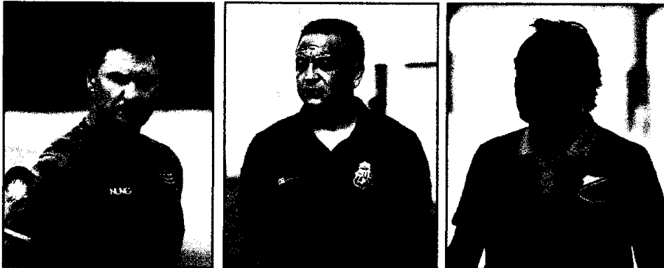
Brigatti pode voltar a treinar o Tricolor

Clube avalia possibilidades no mercado para o lugar de Léo Condé; diretoria mantém sigilo, enquanto outros técnicos negam contato